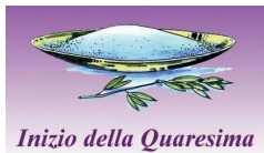
Inizio della Quaresima